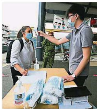
民眾在進入靈市SS2巴剎前，必須接受工作人員測量體溫及記錄等程序，確保體溫正常才能進入巴剎。

早市巴剎設有2個出入口，即在SS2/61路及SS2/67路，民眾必須使用以上2個出入口進出巴剎，SS2/62路的路口則會暫時關閉，僅供小販在開檔前卸貨用途。