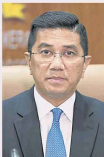
阿兹敏：RCEP 将成全球最大贸易协定。