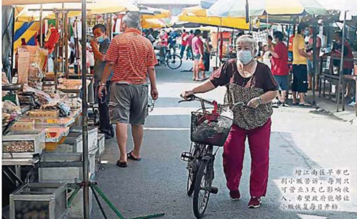
增江南區早市巴剎小販告訴，每周只可營業3天已影響收入，希望政府能够让小販恢復每日開檔。