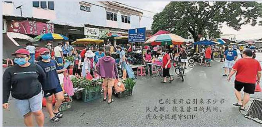
巴剎重开后引来不少市民光顾，恢复昔日的热闹，民众受促遵守SOP

Provided for client's internal research purposes only. May not be further copied, distributed, sold or published in any form without the prior consent of the copyright owner.