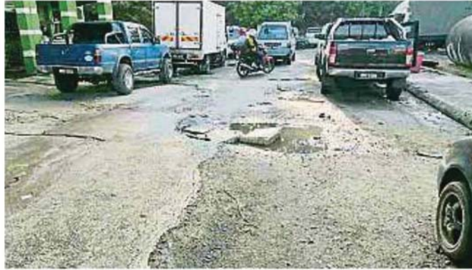
巴生中路大巴剎PKNS店面有許多商店和超市，上午時段的車流量相當高，路況不佳對駕駛人士構成不便。