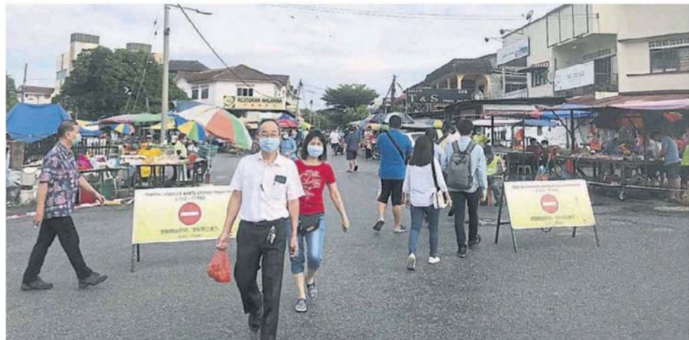
■蕉赖11哩新村巴刹已重开。

Provided for client's internal research purposes only. May not be further copied, distributed, sold or published in any form without the prior consent of the copyright owner.