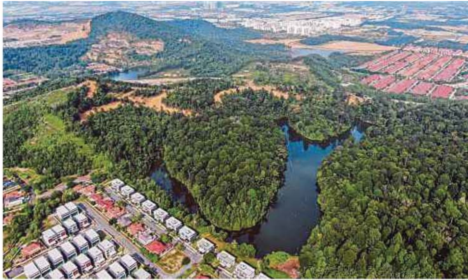
An aerial view of Perdana Heights in Section U10, Shah Alam, revealing the scale of deforestation at the nearby forest reserve.

Provided for client's internal research purposes only. May not be further copied, distributed, sold or published in any form without the prior consent of the copyright owner.