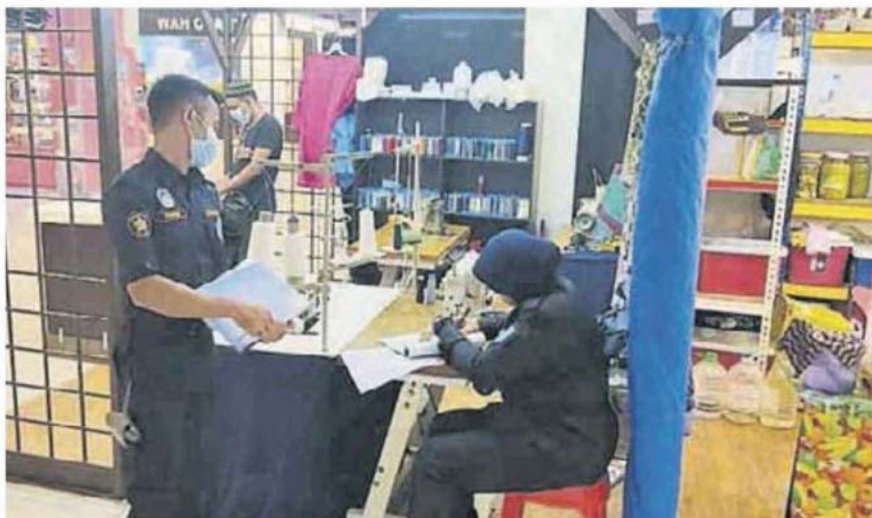
■ 執法員開罰單給違例商家。