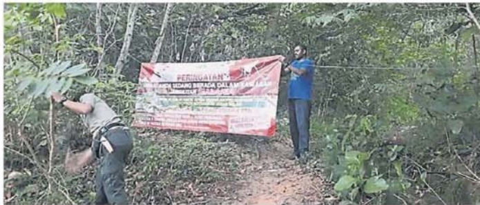
身在疟疾疫区「的横幅。安邦再也市议会封山后，乌冷卫生局

“我已要求卫生局人员最好联络我和当地市议员，以利验血工作的进行，莲花苑团队也会到来帮忙，另外，若居民有疑虑可以要求查证卫生局人员的证件。”