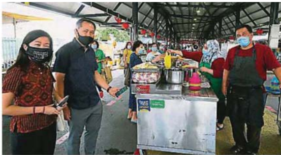
報導 ▶ 鍾可婷 攝影 ▶ 譚湘璇

Provided for client's internal research purposes only. May not be further copied, distributed, sold or published in any form without the prior consent of the copyright owner.