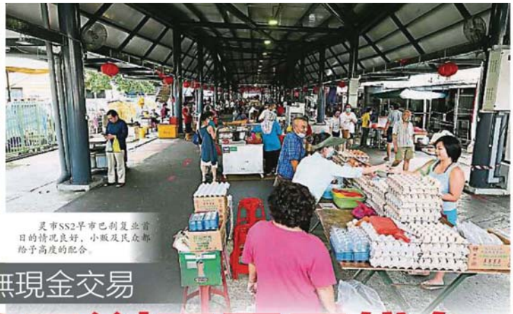
靈市SS2早市巴剎復業首日的情况良好，小販及民眾都給予高度的配合。