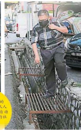
入夜市 由于夜市周边没有围起封锁线,民众仍可从商业区的泊车位进入