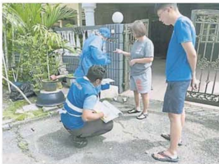
乌冷卫生局人员沿户在英雄花园为居民抽取血液样本，以检测是否染疾。

他说，根据条例，若登山客私闯，一旦被捉将罚款 1 万令吉，包括从合大岭和蕉赖斯嘉岭山脚登山者也一样会被罚款。