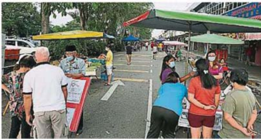
所有访客或购物者在万津直落昆仑路早市巴刹入口处，都必须先登记或扫描二维码及测量体温。

Provided for client's internal research purposes only. May not be further copied, distributed, sold or published in any form without the prior consent of the copyright owner.