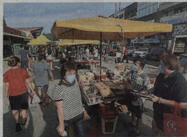
■SS2夜市恢复营业，许多民众首日就到访光顾。SS2夜市是灵市首个复业的夜市。

他还称，公会聘请4至5名志愿警卫人员协助控制人潮，小贩也需自己“赶客”，劝顾客不可逗留太久，买了就走，让其他人有机会逛夜市。(TTE)