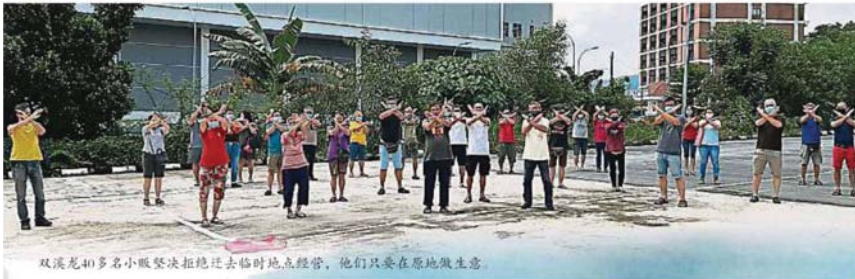
雙溪龍40多名小販整決拒絕遷去臨時地點經營，他們只要在原地做生意。

Provided for client's internal research purposes only. May not be further copied, distributed, sold or published in any form without the prior consent of the copyright owner.