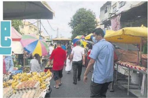
■到巴剎購物的民眾，多數沒有社交距離意識。