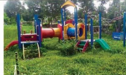
Uncut grass at the playground of Seri Pulai Apartment deprives children from having fun and exercise.

vene and help them come up with a plan to improve matters.